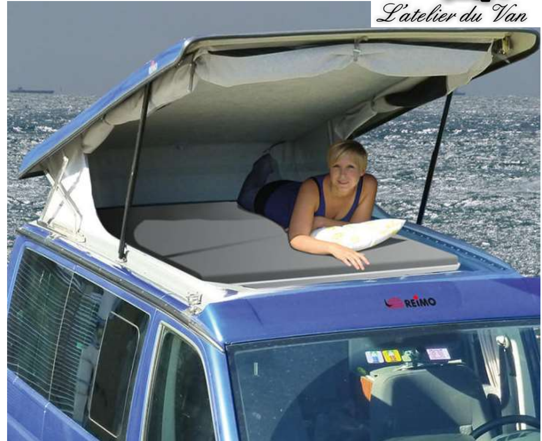
Open sky: ouverture panoramique de la toile, valable uniquement pour toits T5/T6 courts, avec ouverture vers l'avant