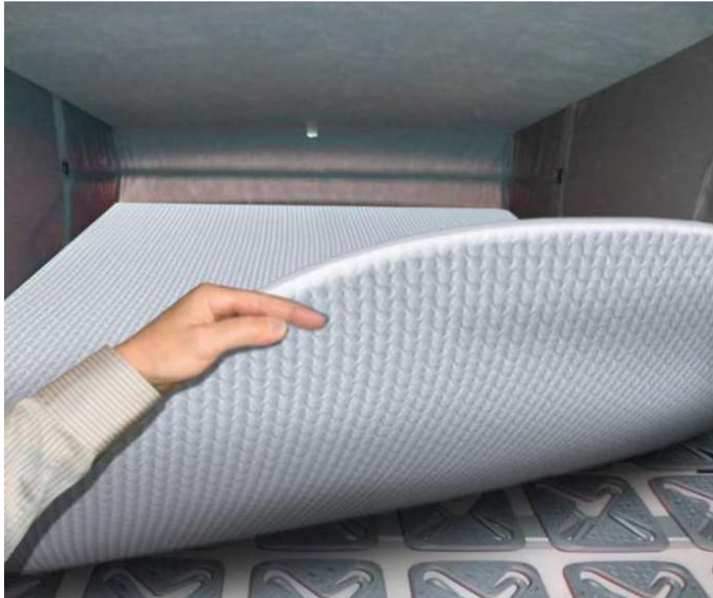
Sommier à plot en étoile FROLI, pour un confort optimal